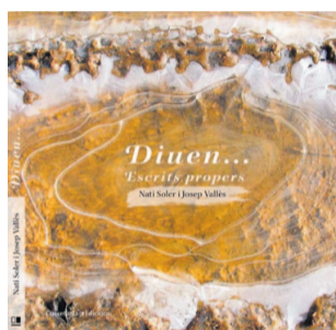
El llibre es presenta a la biblioteca Torras i Bages