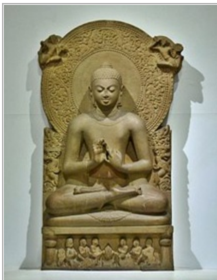
Estatua del Buda Gautama del siglo IV a. C. en la ciudad de Sarnath, distrito de Benarés, estado de Uttar Pradesh, India.

Entre estos nuevos teólogos, destaca Paul F. Knitter , del que hemos publicado un extenso trabajo sobre el ecohumanismo de un teólogo creativo . Como apuntaba el jesuita y teólogo experto en hinduismo Jacques Dupuis ( El cristianismo y las religiones. Del desencuentro al diálogo . Sal Terrae, Santander, 2002), cuando hablamos de “teología de las religiones” o del “pluralismo religioso”, no se debe entender el genitivo sólo en sentido objetivo, como si se tratase de un objeto nuevo sobre el que investigar.