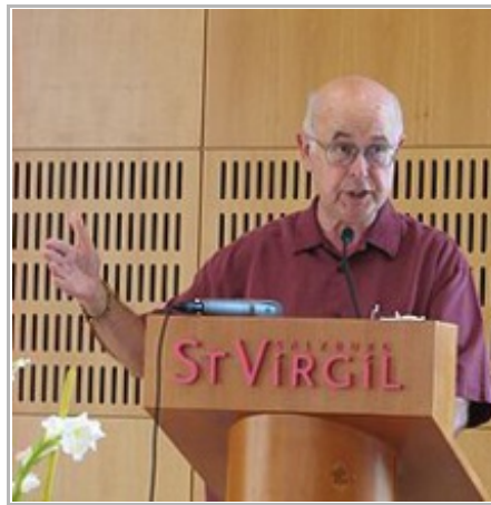
Paul F. Knitter.

a) Mis conflictos: el Otro trascendente (pág 28). Para Knitter, el problema de fondo es la dificultad para superar una mentalidad occidental dualista. “Aunque puede que muchos de mis profesores de la Pontificia Universidad Gregoriana en los años sesenta fueran demasiado escrupulosos en su determinación de salvaguardar la intocabilidad trascendente de Dios, aunque la alteridad de Dios pueda pesar más para mi generación que para la de mis hijos, de todos modos, sé que para muchos cristianos contemporáneos hay un problema fundamental y de profundo alcance en la forma en cómo los cristianos imaginan y hablan sobre el Dios Otro. Voy a darle un nombre filosófico a este problema [...]. Durante la mayor parte de su historia [...], el cristianismo ha estado asediado por el problema del dualismo ” (pág. 34).