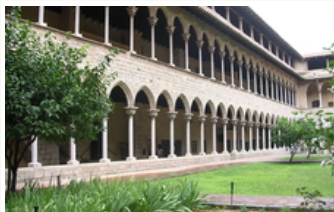
Claustre del monestir de Pedralbes