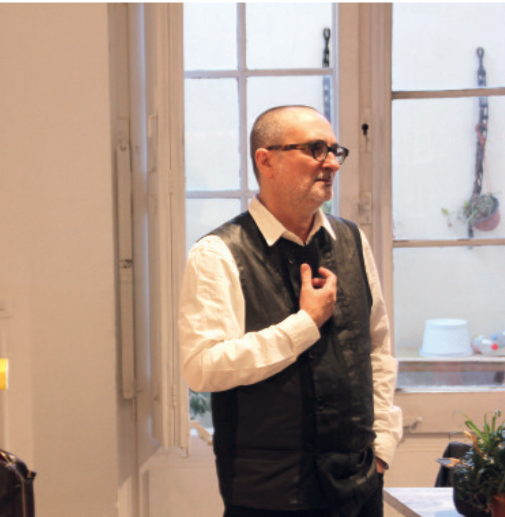
Foto: Joan-Carles Mèlich (Barcelona, 1961) és doctor en Filosofia i Lletres per la Universitat Autònoma de Barcelona.