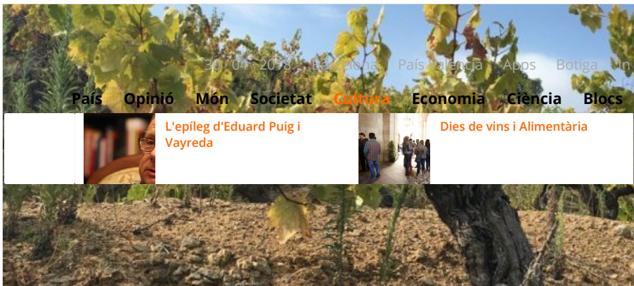
Cep vell

Arribar a la lentitud amb el conreu de la vinya i l'elaboració del vi. Idees que aporta el teòleg José Tolentino Mendoza en el llibre 'Petita teologia de la lentitud'