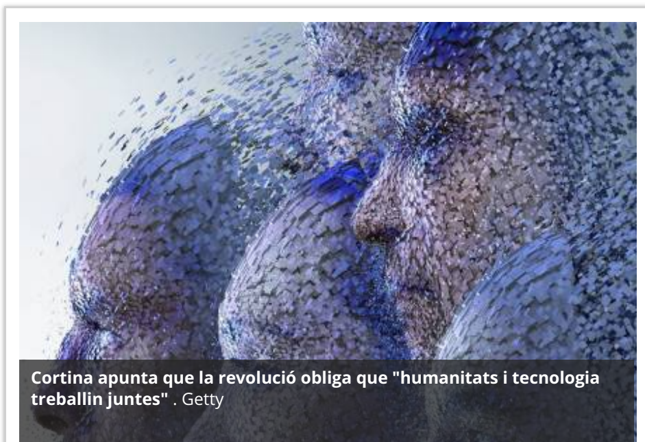
Cortina apunta que la revolució obliga que "humanitats i tecnologia treballin juntes".

El 'transhumanisme' promou la integració de la biologia amb la tecnologia per millorar l'ésser humà i fer-lo súper-intel·ligent i súper-longeu