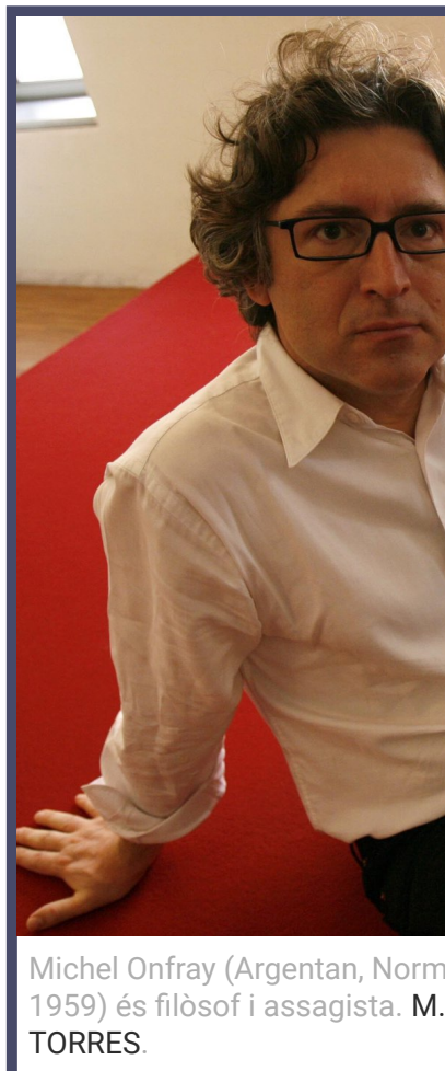
Michel Onfray (Argentan, Normandia, 1959) és filòsof i assagista.

“Ser nietzscheà no és pensar com Nietzsche [...], sinó pensar a partir d’ell ”, sosté Michel Onfray (la cursiva és seva). L'autor normand ha publicat un centenar d'obres, i totes, fora d'un recull poètic, duen un epígraf del filòsof alemany. El llegeix des que era adolescent, el rellegeix sovint (alguns títols més que d'altres), i, com fan les vaques amb l'herba, en rumia una vegada i una altra la substància. El seu mètode a l'hora d'enfrontar-se a la producció del pare del Zaratustra –un mètode que referma en aquest llibret,