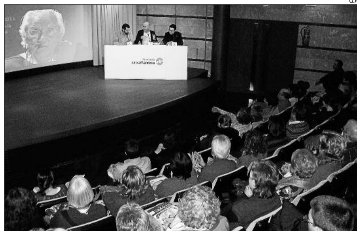
L'auditori de la Plana de l'Om es va omplir en l'homenatge a Panikkar