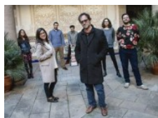
Puja a Núvol