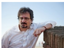
Albert Sánchez Piñol. Quan érem genocides